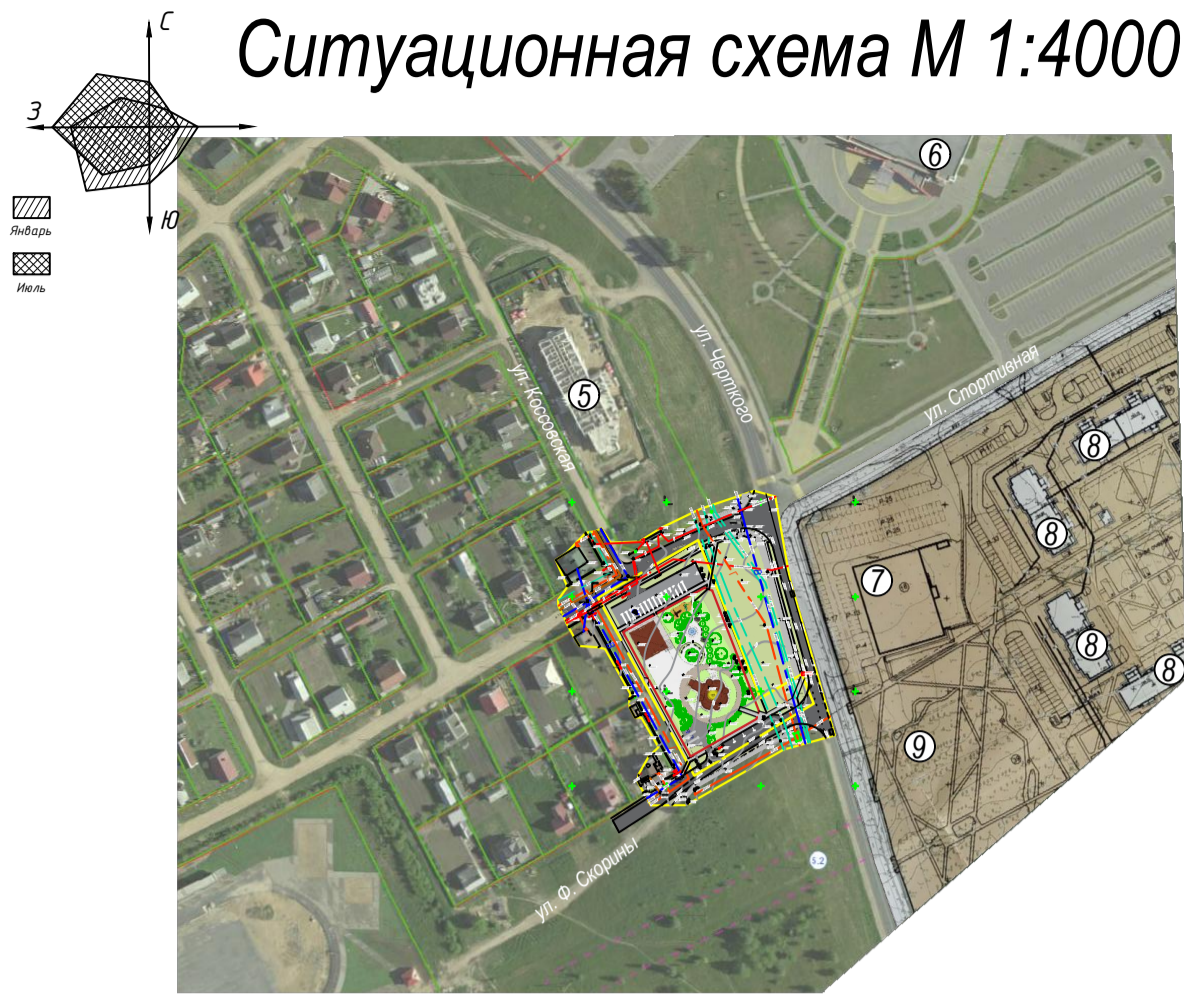
Ситуационная схема М 1:4000